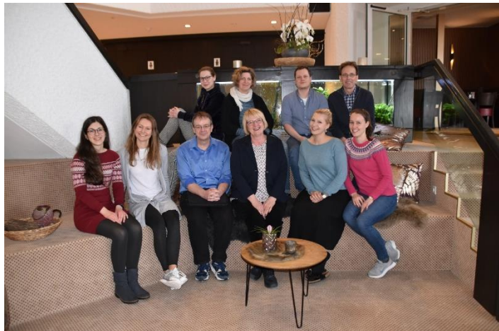
Das Fachgebiet Arbeitswissenschaft (Teil)

Ein Fokus lag auf der nächsten Erhebungswelle der lidA Studie, die im Jahr 2021 durchgeführt werden sollte. Zu dem Zeitpunkt waren die Auswirkungen der COVID-19-Pandemie für die Arbeitswelt und auch die lidA-Studie noch nicht zu erkennen. Nun kam aber doch einiges anders als geplant. Wie es aufgrund von COVID-19 jetzt mit lidA weitergeht, können Sie auf Seite 6 erfahren.